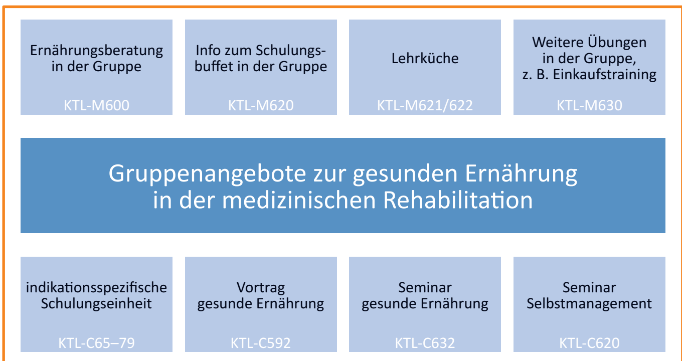
Abbildung 2: Gruppenangebote zur gesunden Ernährung

Um langfristig eine gesunde Ernährung umsetzen zu können, sollten die Rehabilitandinnen motiviert sein (Motivation, Emotion) und die Grundlagen der gesunden Ernährung kennen (Kenntnisse). Sie sollten Möglichkeiten einer gesunden Ernährung auf ihren persönlichen Alltag übertragen können (Alltagsbezug) und die notwendigen Fähigkeiten